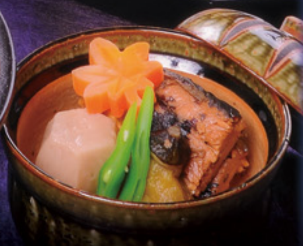
ゆったり会席コースイメージ